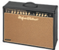
~230 V line jack