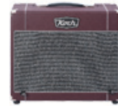
~230 V line jack mic