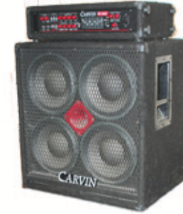
~230 V line XLR