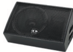
Monitor lead vocal